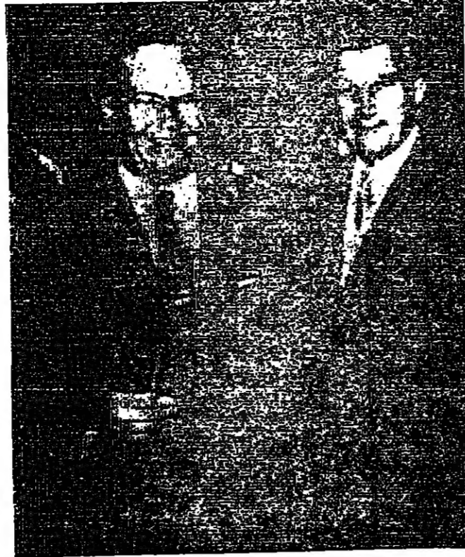
اجتمع امس الاول في قرية «نرشالكا» على الحدود الرومانية - اليوغوسلافية الرئيسان نيتو وسوسيكو لتدريس الوضع في تشيكوسلوفاكيا. وفي الصورة بين الرئيسان عقب انتهائهما لاجتماعات «صورة لاسلكية لليونانديتريس خاصة بالمستور»

الوكلاء الموزعون شركة المواد الطبية - عمان هاتف ٢٥٣١٢